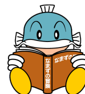
滋賀県イメージキャラクター キャプティ